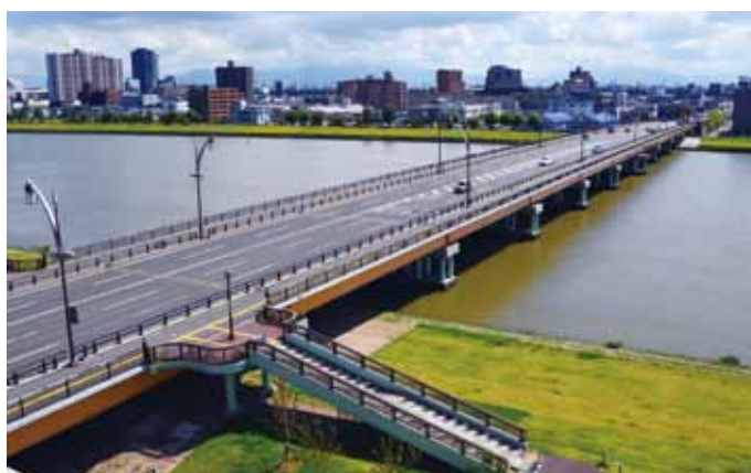
◎ひび割れ注入後50年経過した昭和大桥 【2014年9月2日撮影】