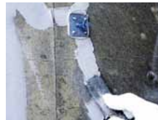
▲取付けパイプの接着とシーリング

取付けパイプを取り除いた後、シール部をディスクサンダーで平坦に仕上げます。必要のある場合は塗装します。