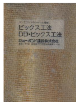
促進耐候性試験 3500時間